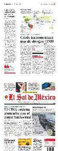
Gráfico: Rodolfo Gómez