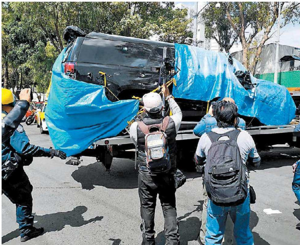
Arrastre de la camioneta, que cuenta con el mayor nivel de blindaje.