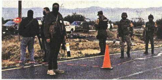
■ Catorce de los cuerpos fueron tirados junto a una carretera.

Los interrogados señalaron ser miembros del CJNG y confesaron diversos crímenes en Juan Aldama.