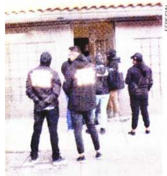
La PDI dio cumplimiento a la orden de cateo en la vivienda.