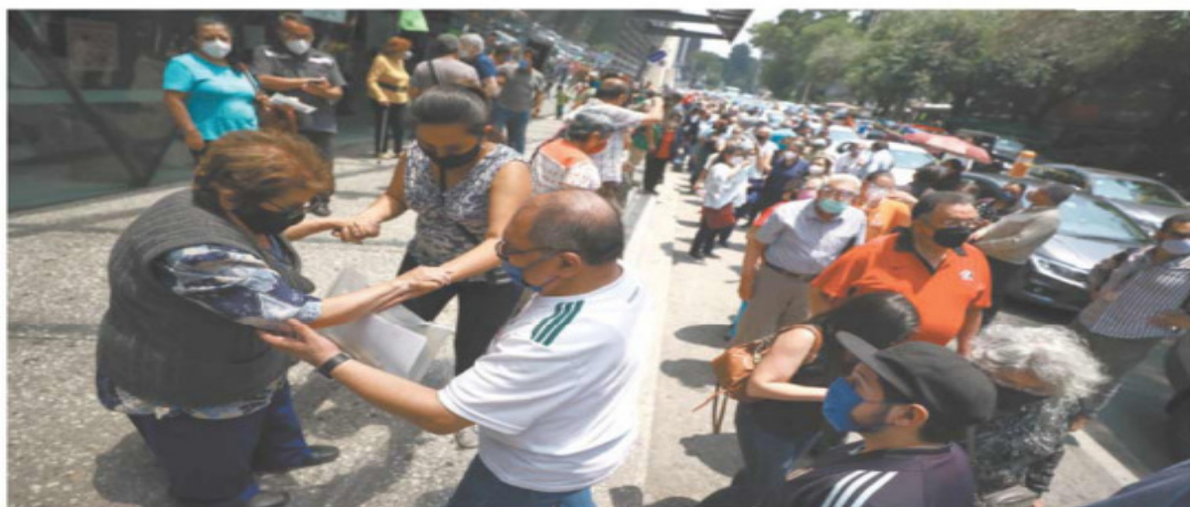
Desesperación y cansancio prevalecieron ayer entre los adultos mayores que acudieron al Pepsi Center a recibir la segunda dosis de la vacuna.