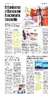
En el domicilio de Blanca está resguardado el material electoral que se ocupará el 6 de junio.