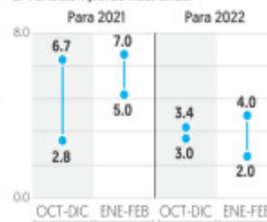
■ Variación porcentual anual