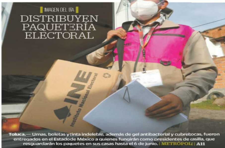
IMAGEN DEL DÍA DISTRIBUYEN PAQUETERÍA ELECTORAL

El politólogo José Antonio Crespo asegura que en esta campaña las propuestas de la 4T fueron las mismas de hace tres años y que la oposición no tuvo un planteamiento nuevo. "Si bailan, cantan o hacen maromas es la principal oferta de campaña... La elección va a ser entre refrendar su gobierno o rechazarlo", ataja. | NACIÓN | A9