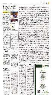
En las escuelas se realizan las jornadas de Tequio.