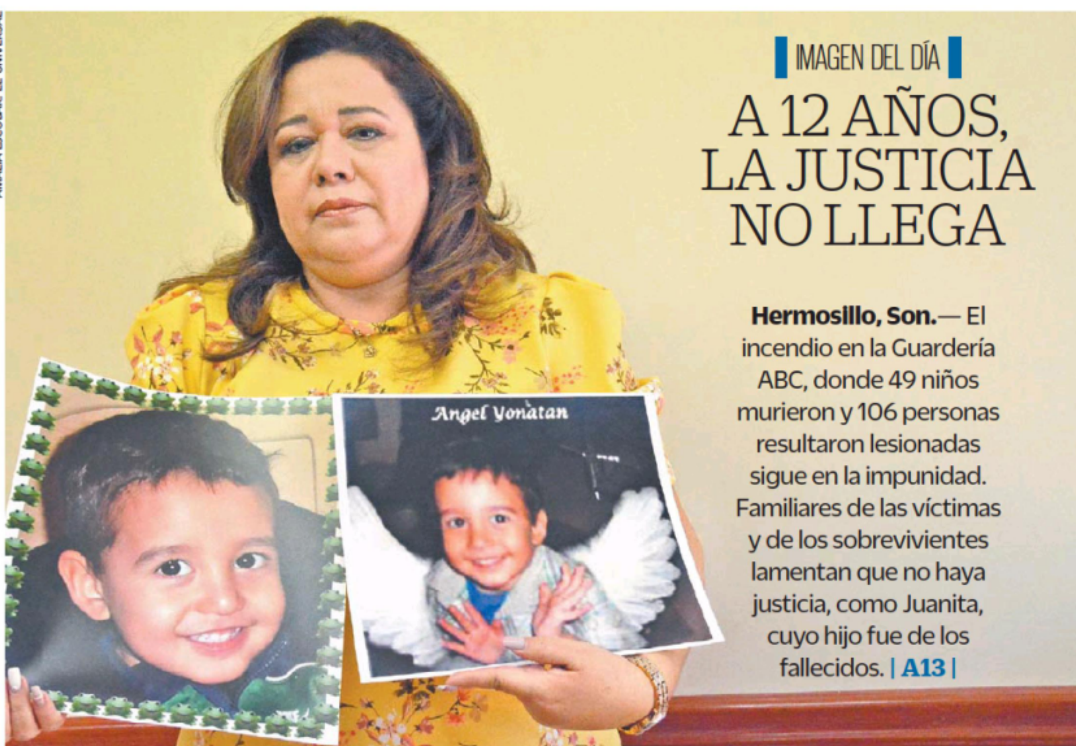
IMAGEN DEL DÍA A 12 AÑOS, LA JUSTICIA NO LLEGA