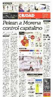
Tras más de un año cerradas, las escuelas abrirán hoy para recibir votantes y mañana, alumnos. Los comicios en tiempo de pandemia.