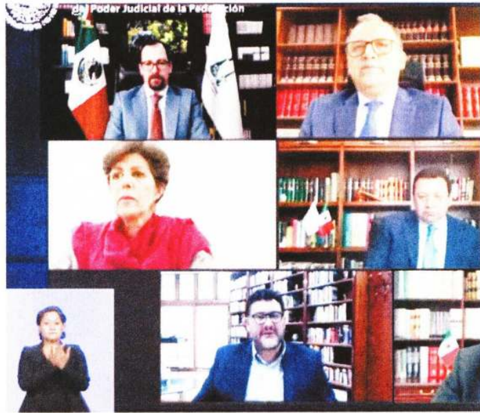
Los magistrados dijeron que este 6 de junio es el día en el que la sociedad decide que prefiere regirse por el orden y la razón.