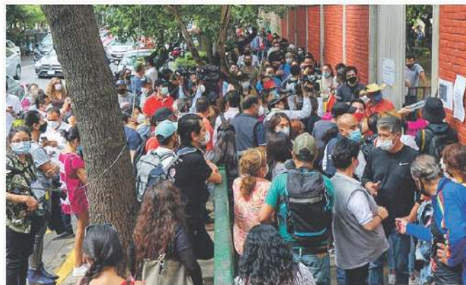
CASILLAS ESPECIALES. Algunas fueron abarrotadas y se quedaron sin boletas.