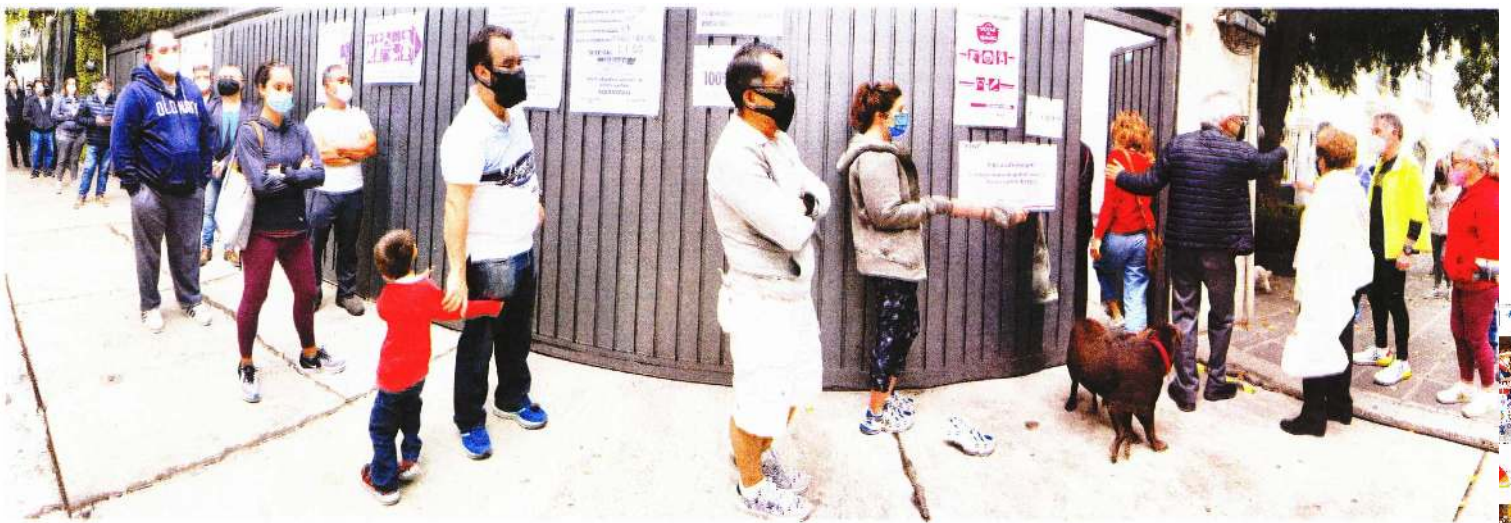
Largas filas se registraron en las casillas en las que los ciudadanos acudieron a votar respetando las medidas sanitarias contra el Covid-19, como el uso de cubrebocas y la sana distancia.