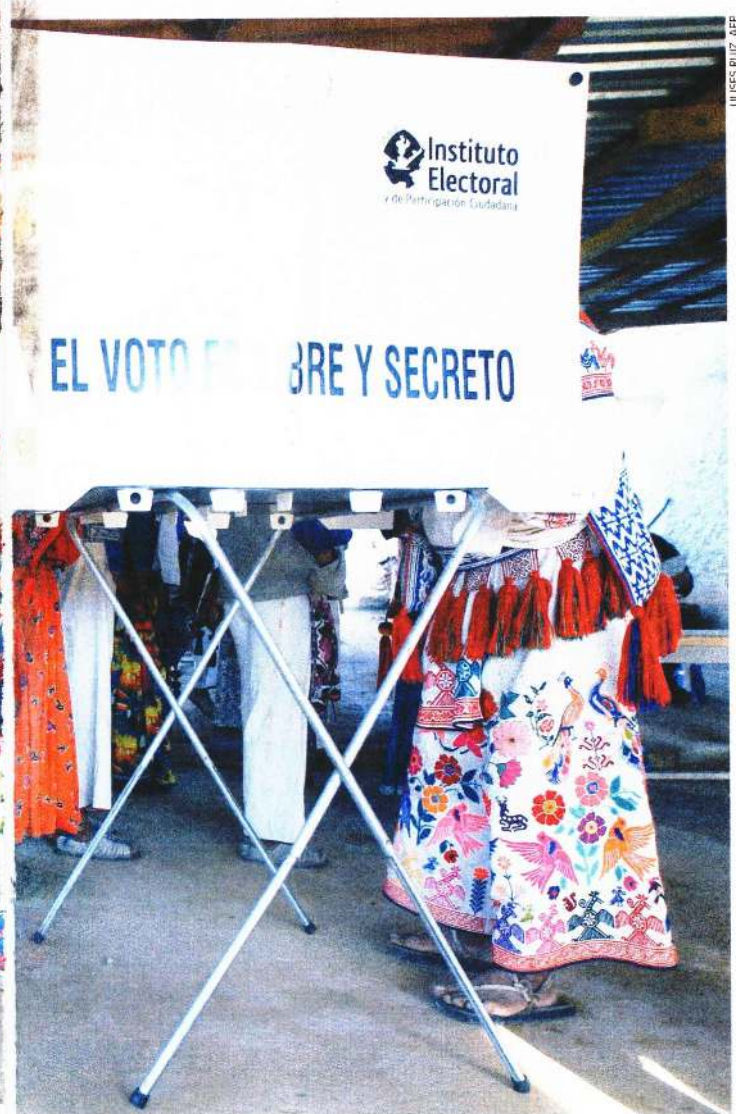
Según el INE, 99.91% de las casillas fueron instaladas; las autoridades electorales celebraron que la ciudadanía saliera a votar para incidir en el futuro del país.