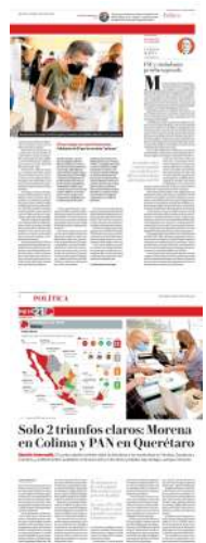
Solo 2 triunfos claros: Morena en Colima y PAN en Querétaro