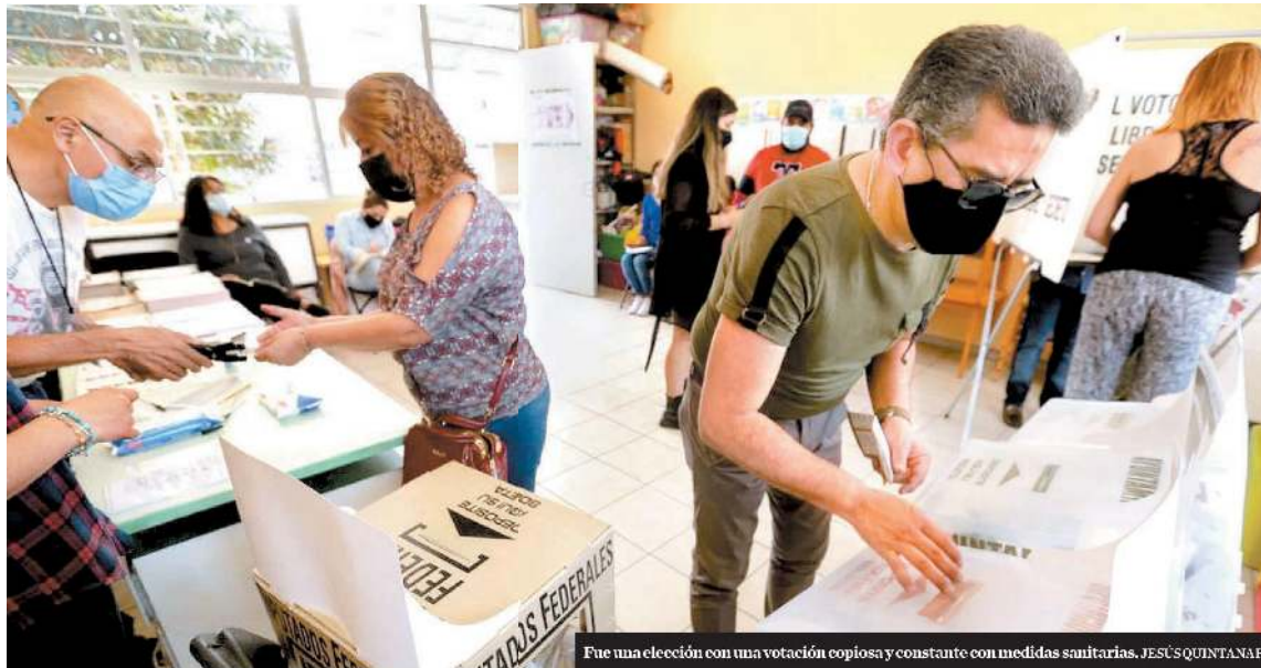
Fue una elección con una votación copiosa y constante con medidas sanitarias. JESÚS QUINTANAR