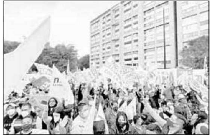
◀ Al grito de "¡fraude!", decenas de seguidores expresaron su respaldo a los candidatos de Morena, quienes se dieron cita en la plaza de las Tres Culturas, en Tlatelolco, para convocar a la unidad.

Los inconformes tienen de plazo para presentar sus medios de impugnación hasta las 23:59 horas de este lunes. Si bien hasta ayer el Tribunal Electoral de la Ciudad de México no había recibido los recursos de manera formal, se espera que en las próximas horas los comiencen a recibir, los cuales se tendrán que resolver en un plazo máximo de 30 días, conforme a la ley procesal local.