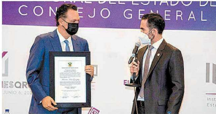
Seis de 11 que ayer recibieron constancia de gobernadores electos: Evelyn Salgado, David Monreal, Alfredo Ramírez Bedolla, Alfonso Durazo, Samuel García y Mauricio Kuri.