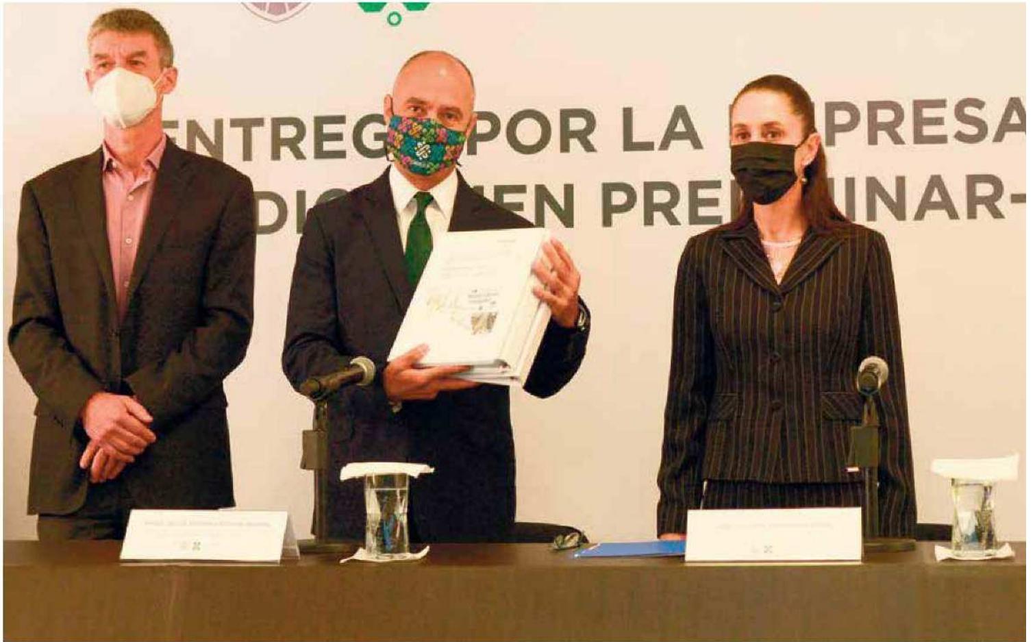
ENTREGA. Representantes de la empresa noruega DNV y la jefa de Gobierno de la CDMX, Claudia Sheinbaum, al presentar el dictamen sobre la L-12.