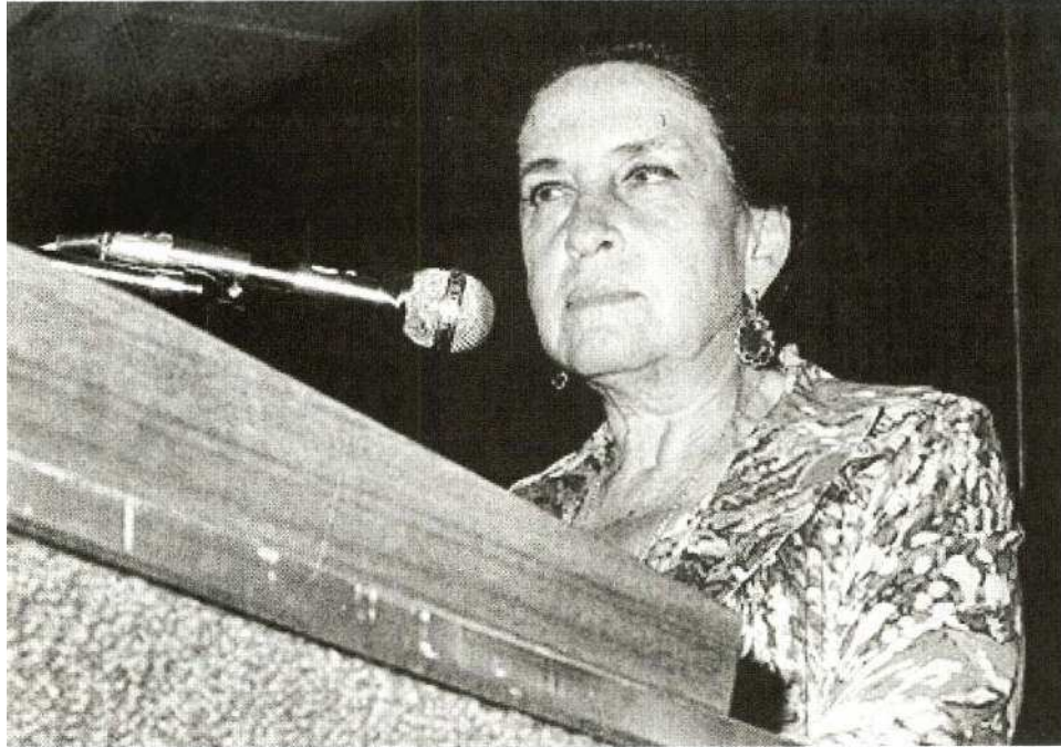
La primera mujer gobernadora fue Griselda Álvarez Ponce de León, quien dirigió el estado de Colima de 1979 a 1985.