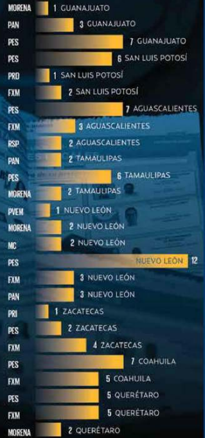
GRÁFICO: ERIK KNÖBL