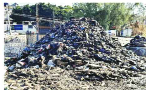
En las 11 presas de la Ciudad deben retirarse las capas de desperdicios para no perder capacidad en lluvias.

Sólo ahí, en 36 horas se llegan a recoger hasta 25 toneladas, debido al tránsito peatonal que existe para ir de los Reyes a Chalco, así como la instalación de un