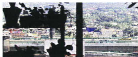
En el sur de la Capital los vecinos padecen el ruido que generan los vehículos que recorren las vialidades primarias.

Ayer, la Sedema detalló que la normativa en proceso de publicación buscará inhibir el uso excesivo de cláxones y bocinas, así como la al-