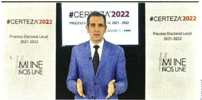
■ Lorenzo Córdova, presidente del INE, llamó a los ciudadanos de las seis entidades con elecciones que participen.

“Es importante recordar que nuestras leyes castigan severamente la compra y coacción del voto y que cualquier ciudadano que sea testigo o víctima de un delito electoral puede y debe denunciar”, dijo Córdova.