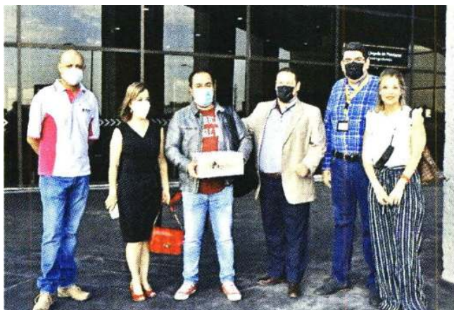
Las autoridades electorales de Tamaulipas resguardaron el paquete que contiene los sufragios del exterior.

Alcántara detalló que ambas modalidades tuvieron la posibilidad del voto anticipado y explicó que el paquete electoral postal será abierto a las 18:00 horas para contar los sufragios, lo que se sumará al voto electrónico.