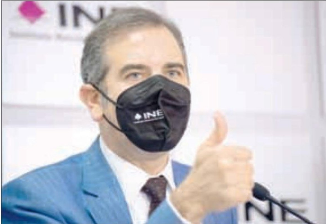
▲ Los votos serán debidamente contados por 147 mil ciudadanos afirma el consejero presidente del INE.