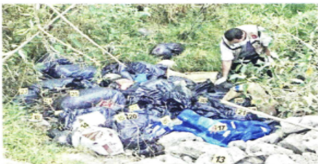
■ A los peritos les tomó cuatro días terminar de recolectar restos y realizar las necropsias correspondientes.

En menos de 5 años, el deprimido vehicular que aminoraría el tráfico en horas pico dejó de ser eficiente. Vecinos coinciden en que las complicaciones ya son como las de antes. PÁGINA 2