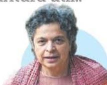
BEATRIZ PAREDES Exdirigente del PRI

“el tema de la alianza ha sido una respuesta de coyuntura útil..”