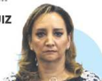
CLAUDIA RUIZ MASSIEU Exdirigente del PRI

“el tema de la alianza ha sido una respuesta de coyuntura útil..”