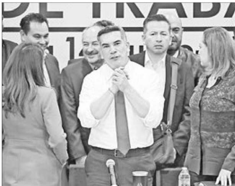
▲ Desde el martes, Alejandro Moreno, líder del PRI, intensificó su participación en reuniones en busca de respaldo para mantenerse en su cargo.

Y fue precisamente el tema de la confianza sobre el que abundaron los críticos del dirigente —quien se incomodó— cuando todos le espetaron que no le tienen confianza. Incluso se le manifestó que la reunión se celebraba para que él reflexionara sobre su estancia en el cargo, y en ese momento salió el Alito que todos conocen. Les respondió que él no tiene nada que reflexionar, que él no fue puesto ahí por ningún presidente de la República, que lo eligieron los votos de los militantes.