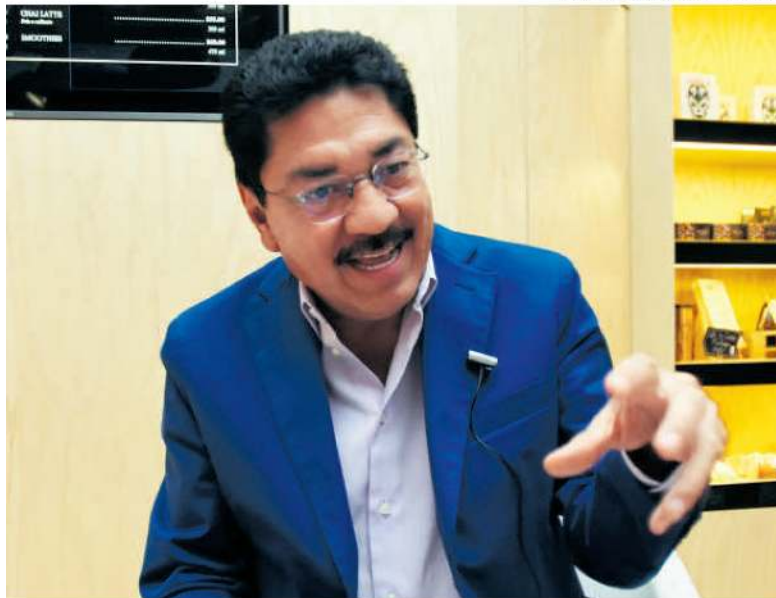
El exgobernador de Oaxaca fue expulsado del PRI en 2021