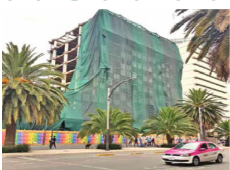
Actualmente la Secretaría de Obras y Servicios demuele el antiguo edificio que albergó a la Secretaría de la Contraloría.