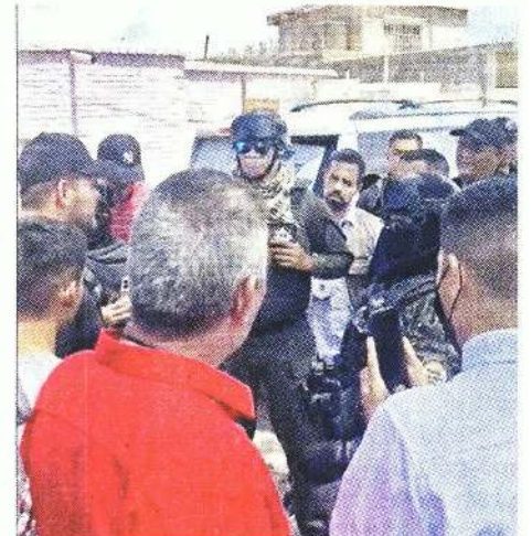
■ Policías estatales se encararon con militantes de Morena en Francisco I. Madero.