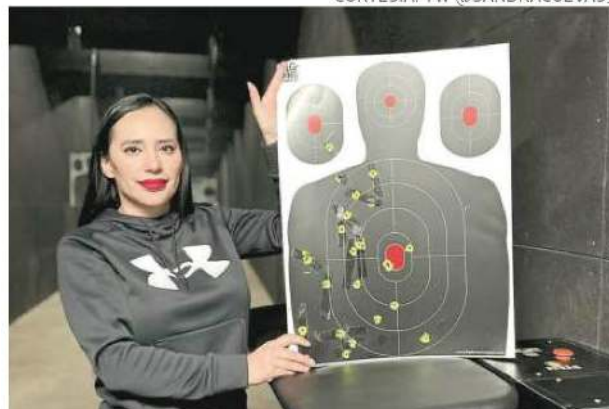
La alcaldesa practicó en un stand en Cuajimalpa