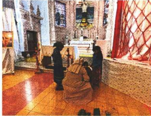
Por años, los padres ayudaron a los habitantes a tener mejores condiciones en la Sierra Tarahumara.

Fueron dos hombres que supieron vivir ese mestizaje entre la cultura indígena y lo mestizo, es eso lo que seguimos recordando”