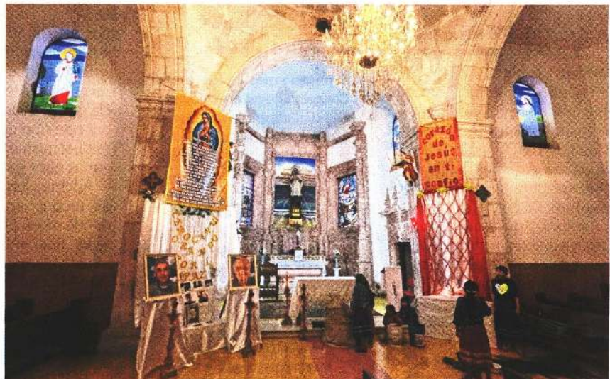
Desde este fin de semana y hasta el 20 de junio se celebrarán misas y diversas actividades para recordar a los padres.