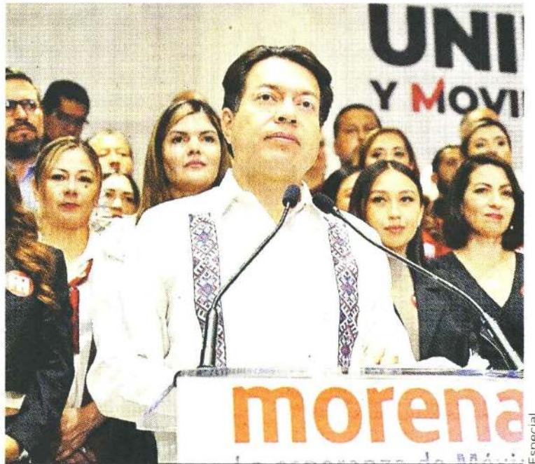
■ Mario Delgado, dirigente nacional de Morena, se reunió con los líderes estatales del partido.

presentaría un posible daño de los principios de certeza y equidad en la contienda por actos que pueden implicar un posicionamiento de los denunciados frente a la ciudadanía”, señala el acuerdo del TEPJF.