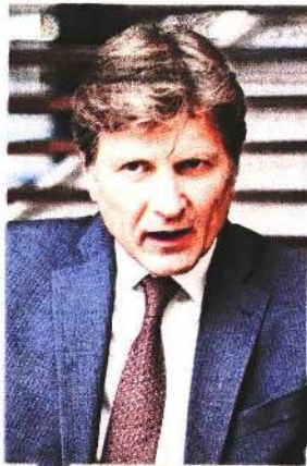
ENRIQUE DE LA MADRID Exsecretario de Turismo

"Debes medir [en los aspirantes a la candidatura] por un lado conocimiento, nombre y popularidad, y, por el otro lado, habilidad y capacidad"