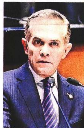
MIGUEL ÁNGEL MANCERA Senador del PRD

"Hice un llamado (...) a que mediante una batería de encuestas, 32 debates y elecciones primarias se nos dé la oportunidad de ser medidos"