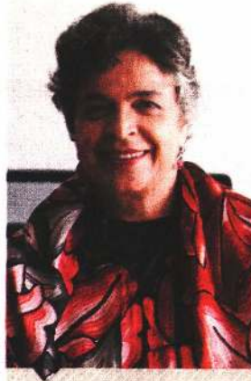
BEATRIZ PAREDES Senadora del PRI

"Creo que deben de emitirse las reglas cuanto antes. Ya lo dije en distintas ocasiones: para mí es fundamental que ya se establezcan las reglas"