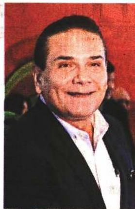
SILVANO AUREOLES Exgobernador de Michoacán (PRD)

"Lo más importante es que los ciudadanos tienen que sentir que esto es de ellos. Si los ciudadanos no lo sienten propio esto fracasará y el que fracasará será el país"