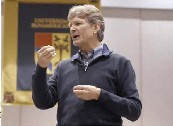
EL ASPIRANTE a la candidatura presidencial, en foto de archivo.