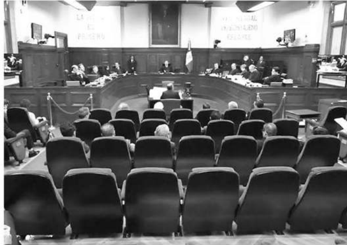
· Ministros dieron marcha atrás a propuesta de AMLO