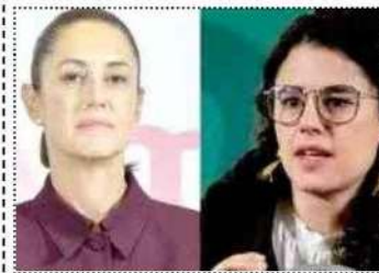
Sheinbaum defiende a Luisa María Alcalde: "la critican por ser mujer, y joven"

Pues esa vieja imagen ya no encuadra con la nueva generación femenina que llega a la Secretaría de Gobernación , después de la exministra en retiro Olga Sánchez Cordero . Sin embargo, nos falta conocer si Luisa María Alcalde cumplirá un rol no acotado, no decorativo, o tendrá un papel decisivo, fuerte, con la confianza plena del Presidente, igual o superior a la desempeñada por el hombre leyenda Fernando Gutiérrez Barrios, o el chiapaneco José Patrocinio González Blanco Garrido y el químicamente calderonista y gallego Juan Camilo Mouríño . Y mientras, en la acera de enfrente, la desesperación invade a los contrarios a Morena , pues por más vueltas que priistas, panistas y perredistas le dan a quién podría ser su candidata a la Presidencia, todas las posibilidades los llevan a una mujer con "agallas" y bien "entrona" como la panista Xóchitl Gálvez , pero no se deciden a anunciarla como su candidata presidencial "por ser mujer" , pues los dirigentes del PRI-PAN y lo que queda del sol azteca se quedaron empantanados en los tiempos prehistóricos en que los cargos de mucha responsabilidad "sólo estaban reservados para los hombres" .