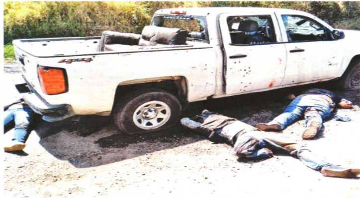
El convoy compuesto por un Jeep, un Dodge Avenger y una camioneta pick up circulaba la tarde del jueves por Puerta del Carmen, cuando un grupo delictivo comenzó a dispararle.

Los elementos de seguridad fueron interceptados en la carretera a Zacualpan y posteriormente en Llano Grande.