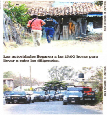
Las autoridades llegaron a las 15:00 horas para llevar a cabo las diligencias.