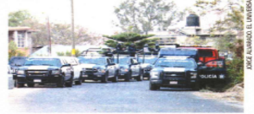
La Secretaría de Seguridad y la fiscalía estatal desplegaron un operativo en la zona.