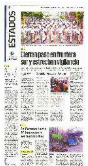
Cientos de agentes del INM participarán en la estrategia para contener el paso de extranjeros de forma ilegal por la frontera sur, al menos por un mes.