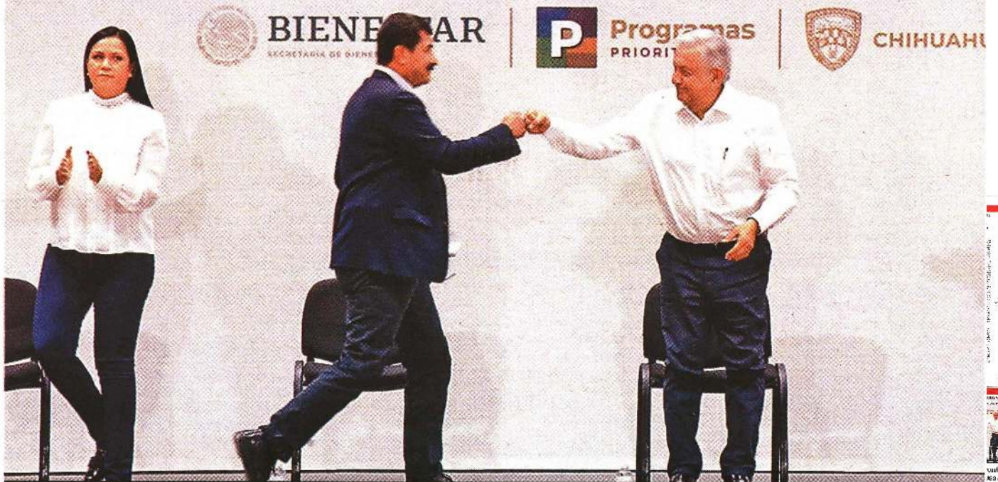
AMLO, de gira por Chihuahua; en Guerrero protestaron por la resolución contra Salgado