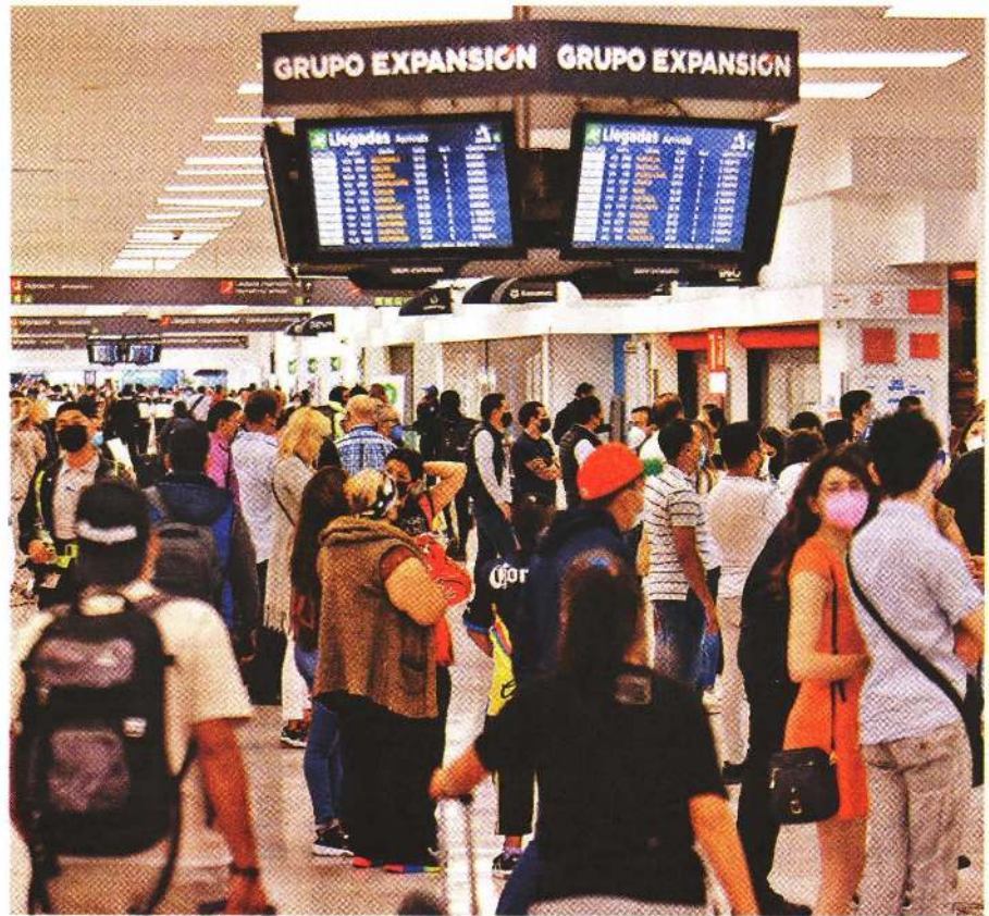
El aeropuerto capitalino, abarrotado por las vacaciones de Semana Santa. JUAN C. BAUTISTA