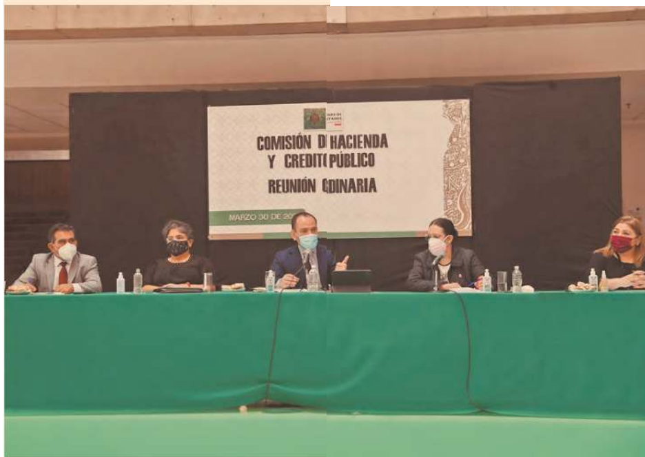
Raquel Buenrostro , jefa del SAT, y Arturo Herrera, secretario de Hacienda, comparecieron ante la Comisión de Hacienda y Crédito Público en San Lázaro.