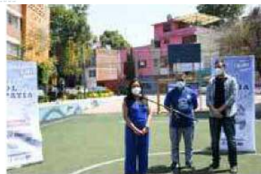
La consulta se realizará por Internet del 21 al 28 de abril. Especial