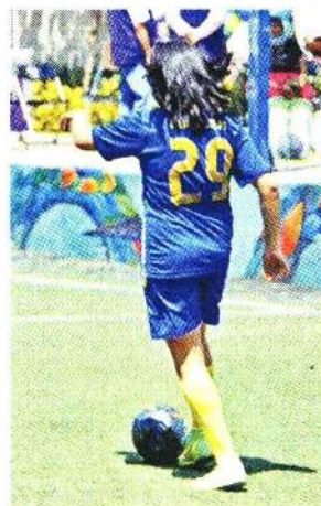
■ Esta cancha se hizo con recursos del Presupuesto Participativo.

“Y, posteriormente a respaldar las propuestas que sean más necesarias en sus colonias, con sus opiniones en la Consulta”, divulgó el IECM.