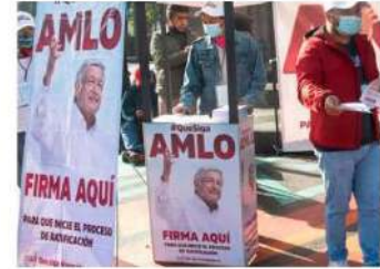
Viola la Constitución.