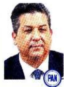
Francisco Javier García Cabeza de Vaca