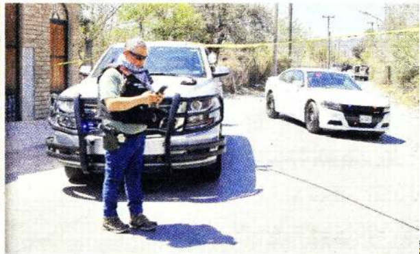
Agentes armados cercaron la propiedad de 8 mil metros cuadrados del ex Gobernador Rodríguez en el municipio de García.