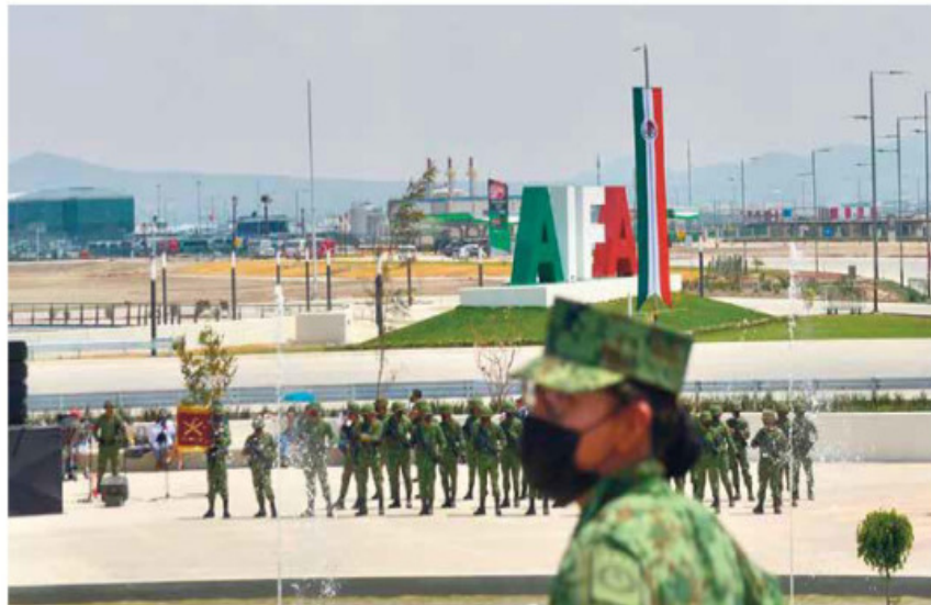
ESTRENO. Con el acto oficial encabezado por AMLO y sus primeros 20 vuelos, comerciales y privados, el Aeropuerto Internacional Felipe Ángeles inició operaciones ayer.

"Un aeropuerto seguro en sus operaciones aéreas, en convivencia operacional con la Fuerza Aérea Mexicana y los aeropuertos del Sistema Aeroportuario Metropolitano, con base en un nuevo diseño del espacio aéreo desarrollado y avalado por nuestros expertos con el objetivo de armonizarnos a la normatividad mundial".