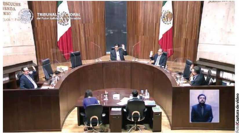
INTEGRANTES del TEPJF en sesión pública, ayer.