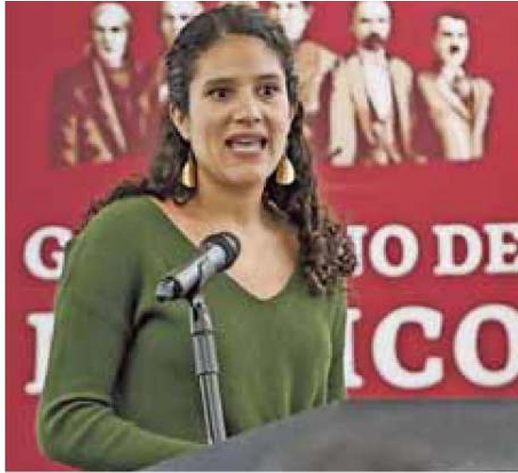
Participación. El comité de evaluación revisó los resultados de 508 personas que aspiran a ser consejeros del INE.