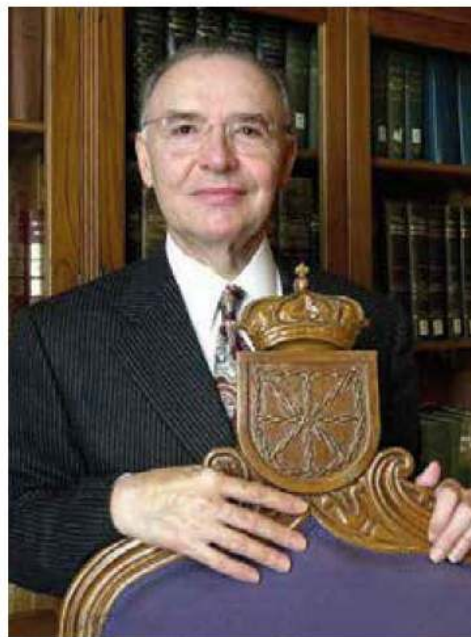
Jorge Carpizo McGregor.