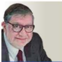
POR CARLOS RAMÍREZ

HTTP:// INDICADORPOLITICO.MX INDICADORPOLITI- COMX@GMAIL.COM @CARLOS RAMIREZH CANAL YOUTUBE: HTTPS://T.CO/2CCG- M1SJGH