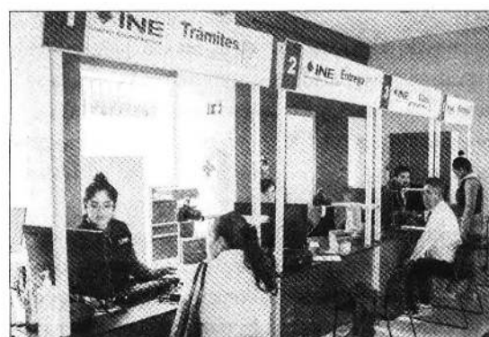
Consejeros han advertido que la compactación por el "plan B" de reforma electoral implica el despido de unos 6 mil trabajadores que costaría 3 mil 500 millones de pesos.

El viernes, AMLO acusó al INE de esconder esos fideicomisos y aseguró que era un "enigma" conocer cuánto dinero había en ellos. Sin embargo, los fondos son públicos, cada tres meses se actualiza la cifra y están en la página del organismo electoral.