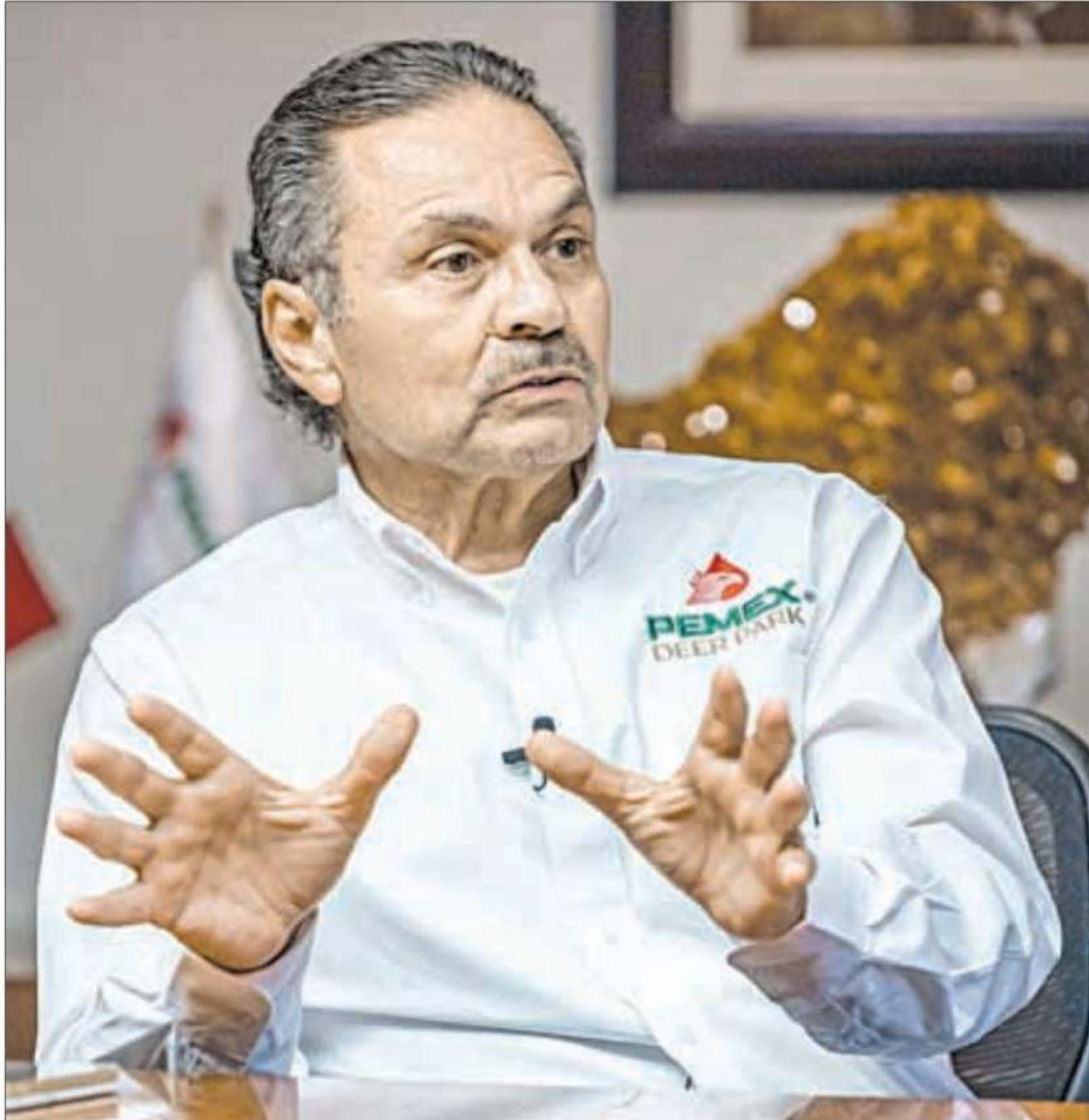
▲ Había una sangría brutal para la empresa y las finanzas del Estado por el robo de combustible, destaca Romero Oropeza.