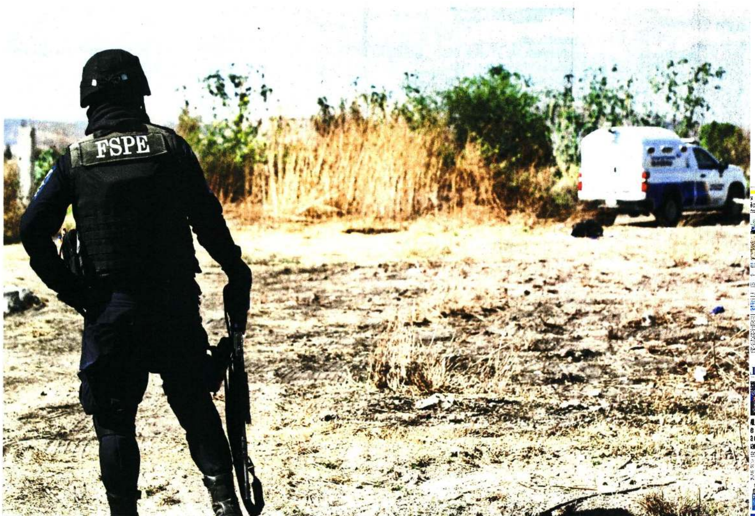
El sitio donde fueron hallados los restos de las mujeres desaparecidas el 7 de marzo es casi inaccesible por la movilidad del crimen organizado, reconocen policías.

"Yo sé que ya no nos la van a entregar viva, pero todavía falta el cuerpo de mi sobrina, que no aparece"