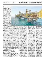
● LA SITUACIÓN DE LA PARAESTATAL

En 2018, la paraestatal estaba en una situación muy crítica, señala