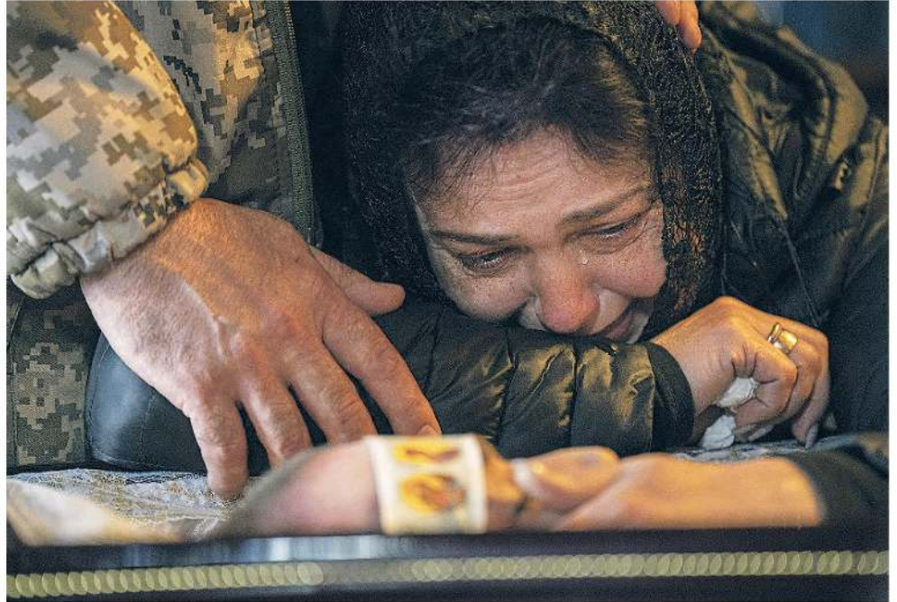
Una mujer llora sobre el ataúd de su marido, un soldado ucraniano, en Kyiv