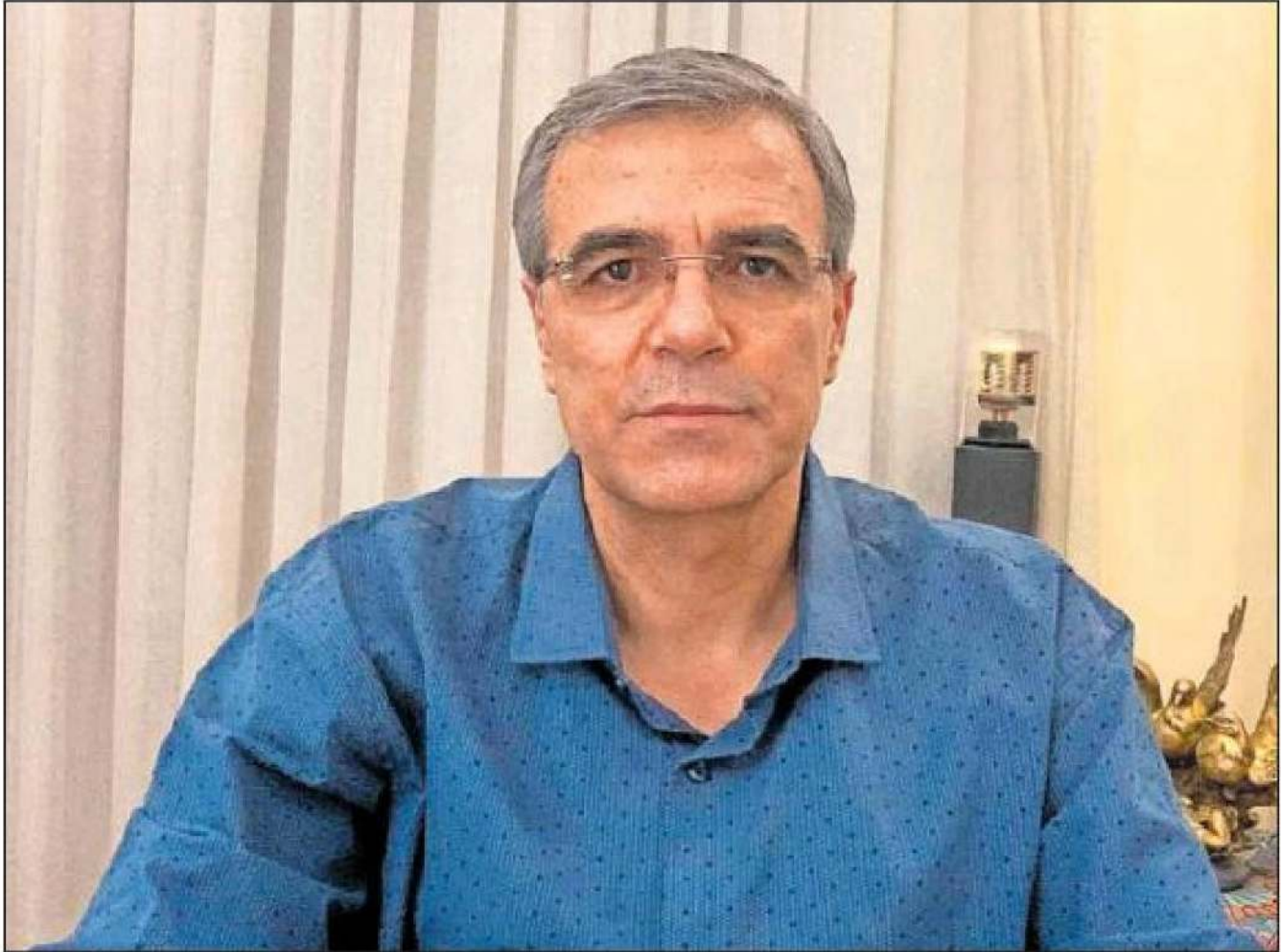
El activista iraní Reza Khandan, en su casa de Teherán, en 2020, en una imagen cedida por él mismo.