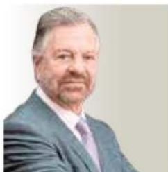
POR JORGE G. CASTAÑEDA.

Traducción del inglés de Nicolás Medina Mora. Revista Nexos