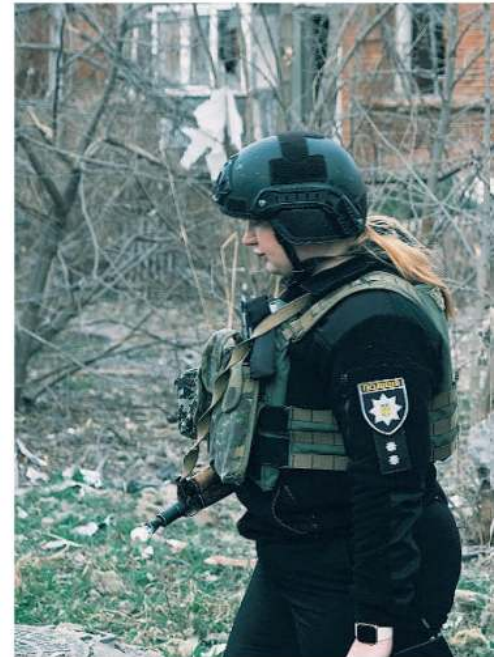
Un herido tras la explosión de un misil en Sloviansk