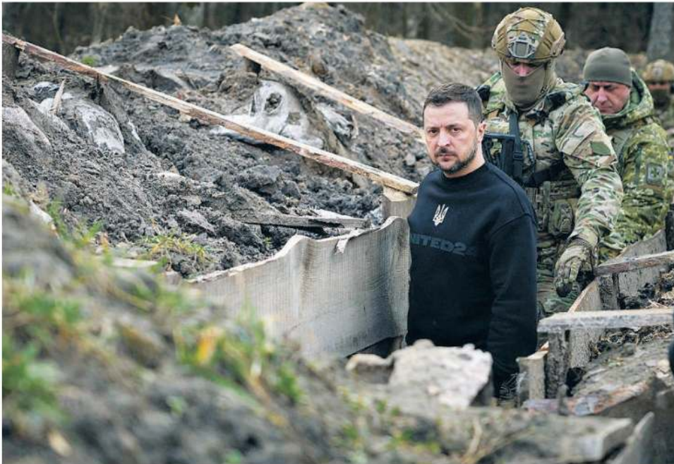
El presidente ucraniano, Volodimir Zelenski, visita una trinchera en Sumy