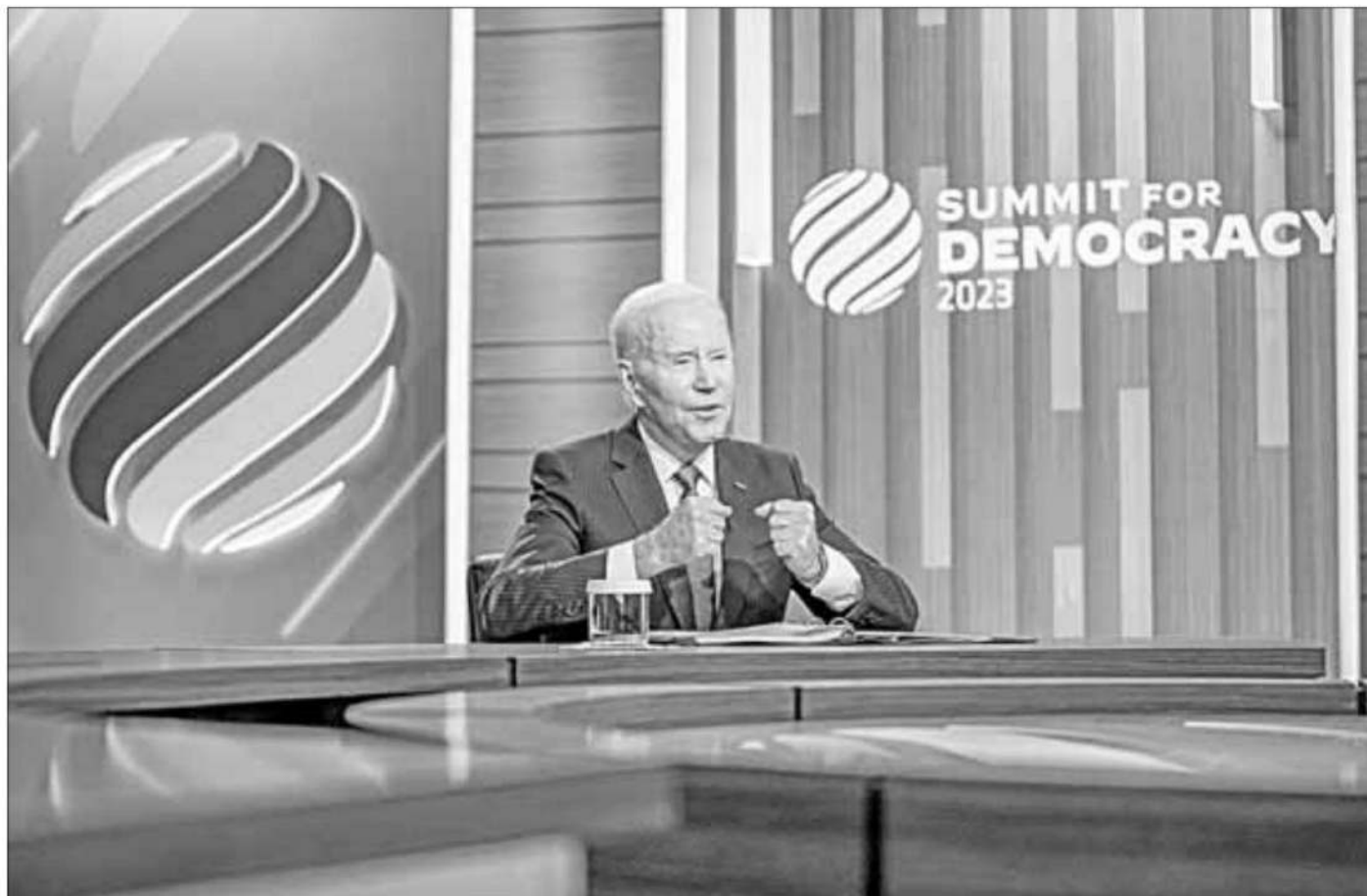
▲ El presidente estadounidense, Joe Biden, ayer en la segunda Cumbre por la Democracia que se celebró en Washington. Esta vez fueron coanfitriones líderes de Costa Rica, Países Bajos, Corea del Sur y Zambia.