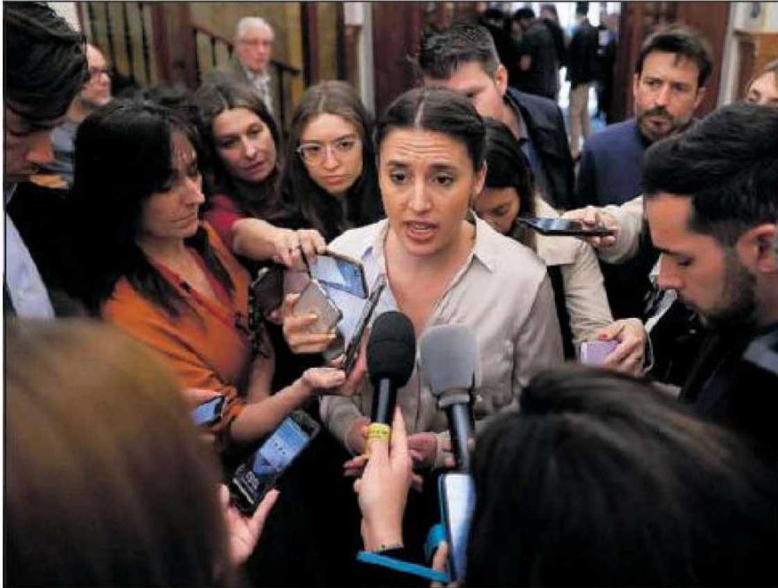
La ministra de Igualdad, Irene Montero, atendía ayer a los medios en el Congreso.