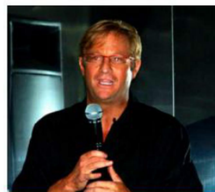
Roemer está acusado de abuso sexual.

Fue en el mes de marzo de este año que se dio inicio a una carpeta de investigación y el 5 de mayo se obtuvo la primera orden de aprehensión por el delito de abuso sexual en contra de una mujer.