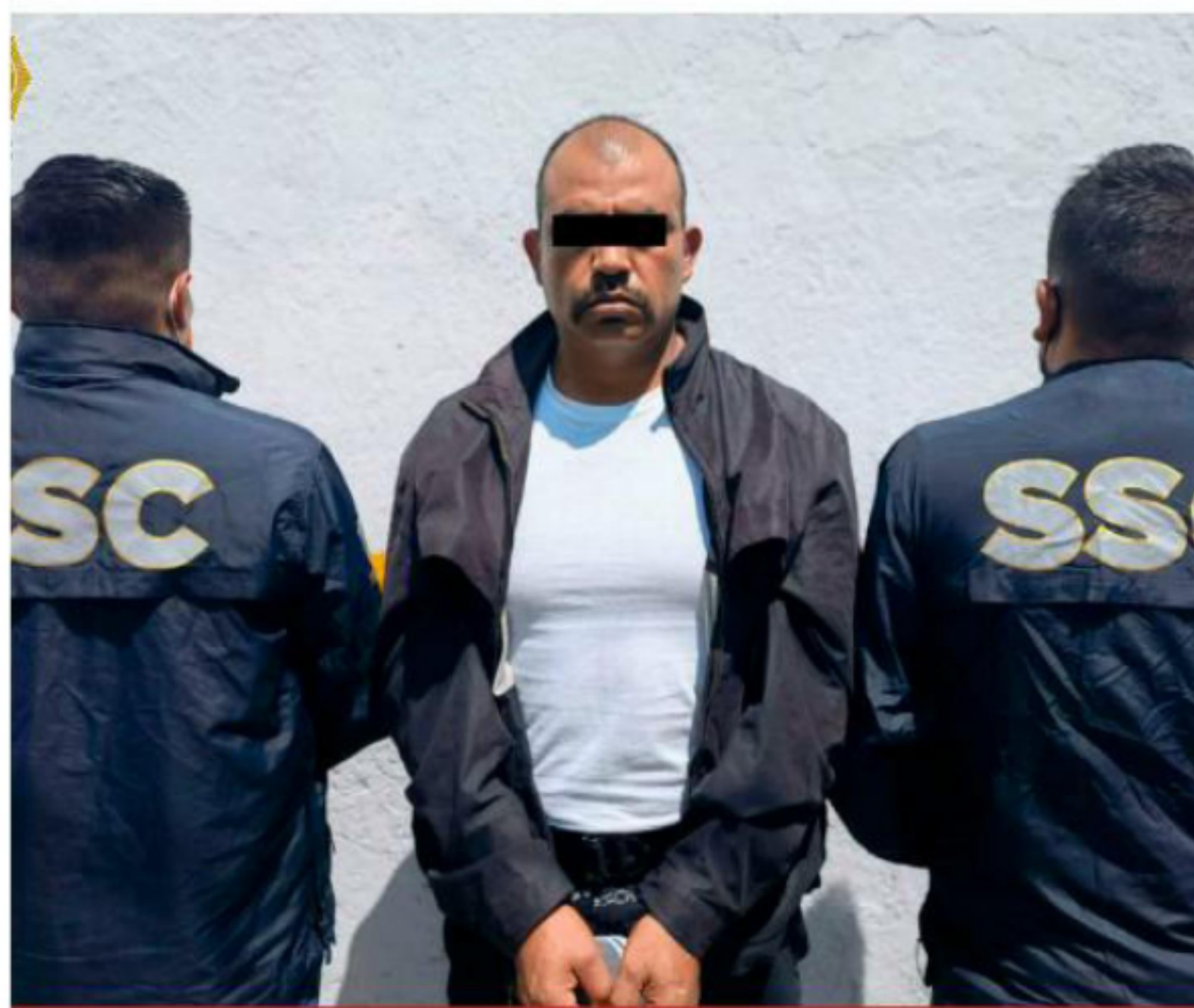
"Depredador" era conocido por los efectivos de la entonces SSP, como un mando prepotente y altanero.

Este jueves el gobierno de la ciudad de México informó que, con la reciente aprehensión de 14 policías, desde octubre del 2019 a la fecha, la Secretaría de Seguridad