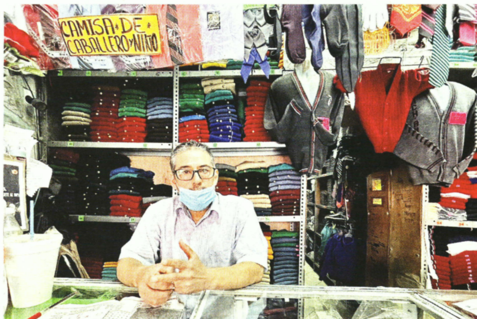
ALTERNATIVAS. Antes de la pandemia, la venta de uniformes era el sustento. Ahora, batas y ropa en general.

En Magdalena Contreras, Milpa Alta, Tlalpan, Xochimilco y Cuauhtémoc se registraron dos casos, mientras que en Álvaro Obregón y Venustiano Carranza hubo uno.