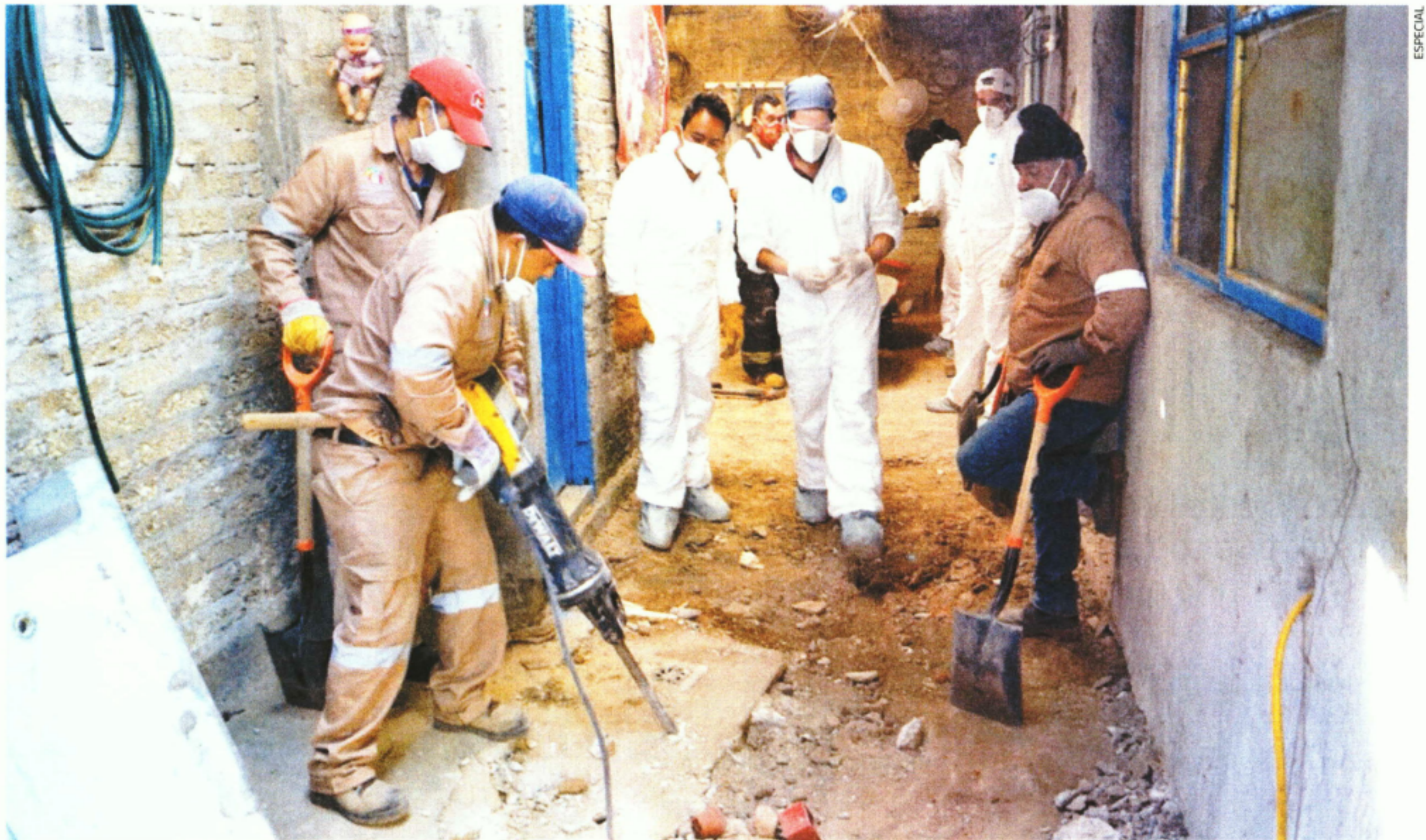
Los trabajos de excavación continúan en el domicilio del presunto feminicida serial de Atizapán, en busca de más restos óseos.