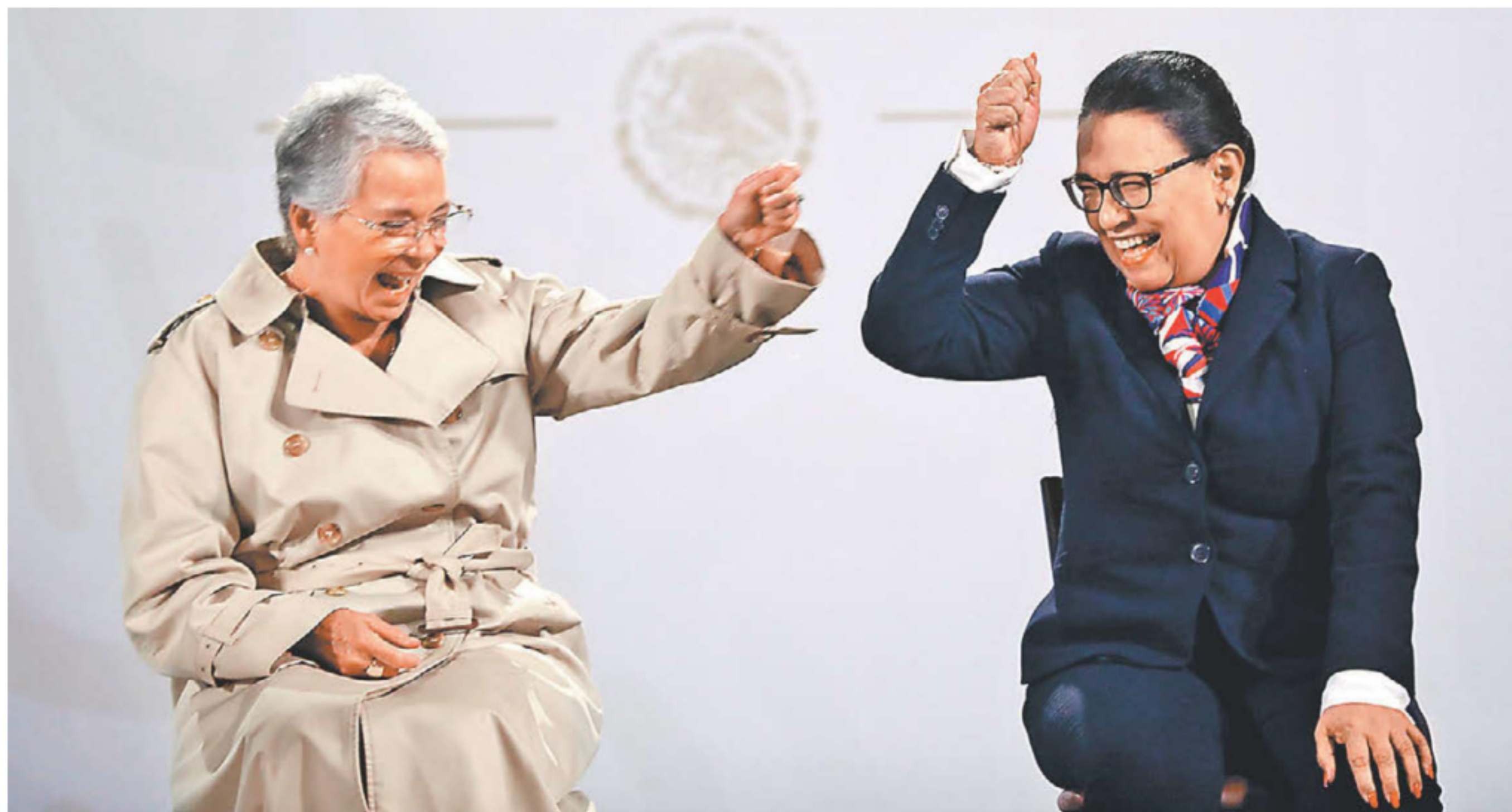
Olga Sánchez Cordero, secretaria de Gobernación, y Rosa Icela Rodríguez, titular de Seguridad.