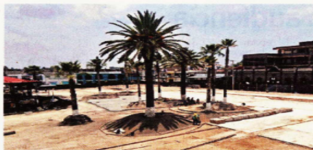
El centro del Municipio de Tultepec, el cual fue derribado, se edificó en 2005.

La Federación destruyó casi toda la Casa de la Cultura municipal, la cual fue construida y acondicionada en diferentes etapas, entre 2008 y 2019. También, derribó por completo una cancha acústica y la plaza cívica ubicadas en el centro del Municipio.