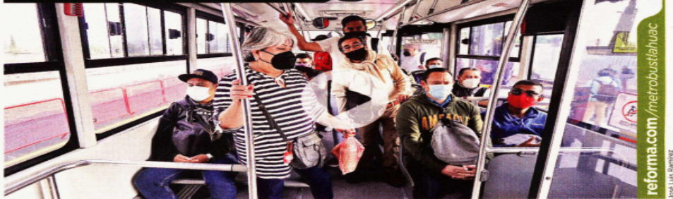
Ayer el Metrobús arrancó operaciones en Avenida Tláhuac, como servicio emergente tras el colapso de la Línea 12.