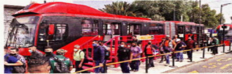
Los usuarios esperan que el articulado reduzca sus tiempos de traslado.

Y aunque hubo conflictos viales, confusiones y quejas en redes sociales por falta de accesibilidad, los usuarios agradecieron el servicio gratuito porque ya llevaban tres semanas gastan-