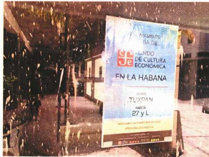
La librería fue llamada Tuxpan, en honor al puerto veracruzano de donde zarpó el buque Granma para iniciar la Revolución Cubana,