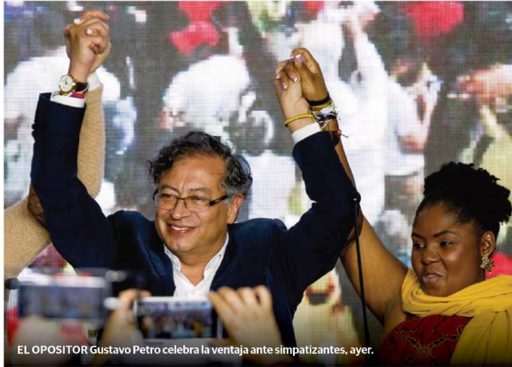
EL OPOSITOR Gustavo Petro celebra la ventaja ante simpatizantes, ayer.