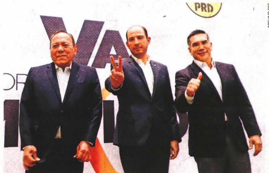
Jesús Zambrano, Marko Cortés y Alejandro Moreno, líderes nacionales de los partidos de la Revolución Democrática, Acción Nacional y Revolucionario Institucional.