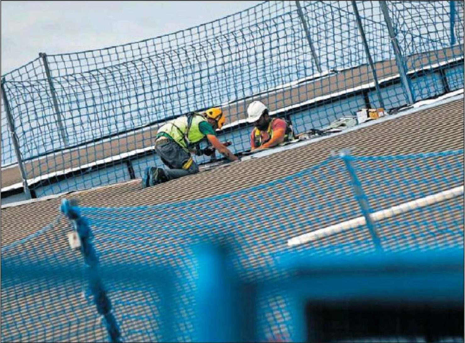
Empleados trabajaban en la cubierta de una nave industrial de Pocomaco el jueves en A Coruña.