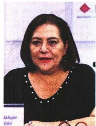
La presidenta del INE, Guadalupe Taddei, dijo que mantendrá algunos apoyos.