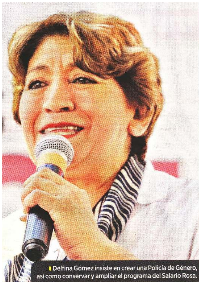
■ Delfina Gómez insiste en crear una Policía de Género, así como conservar y ampliar el programa del Salario Rosa.