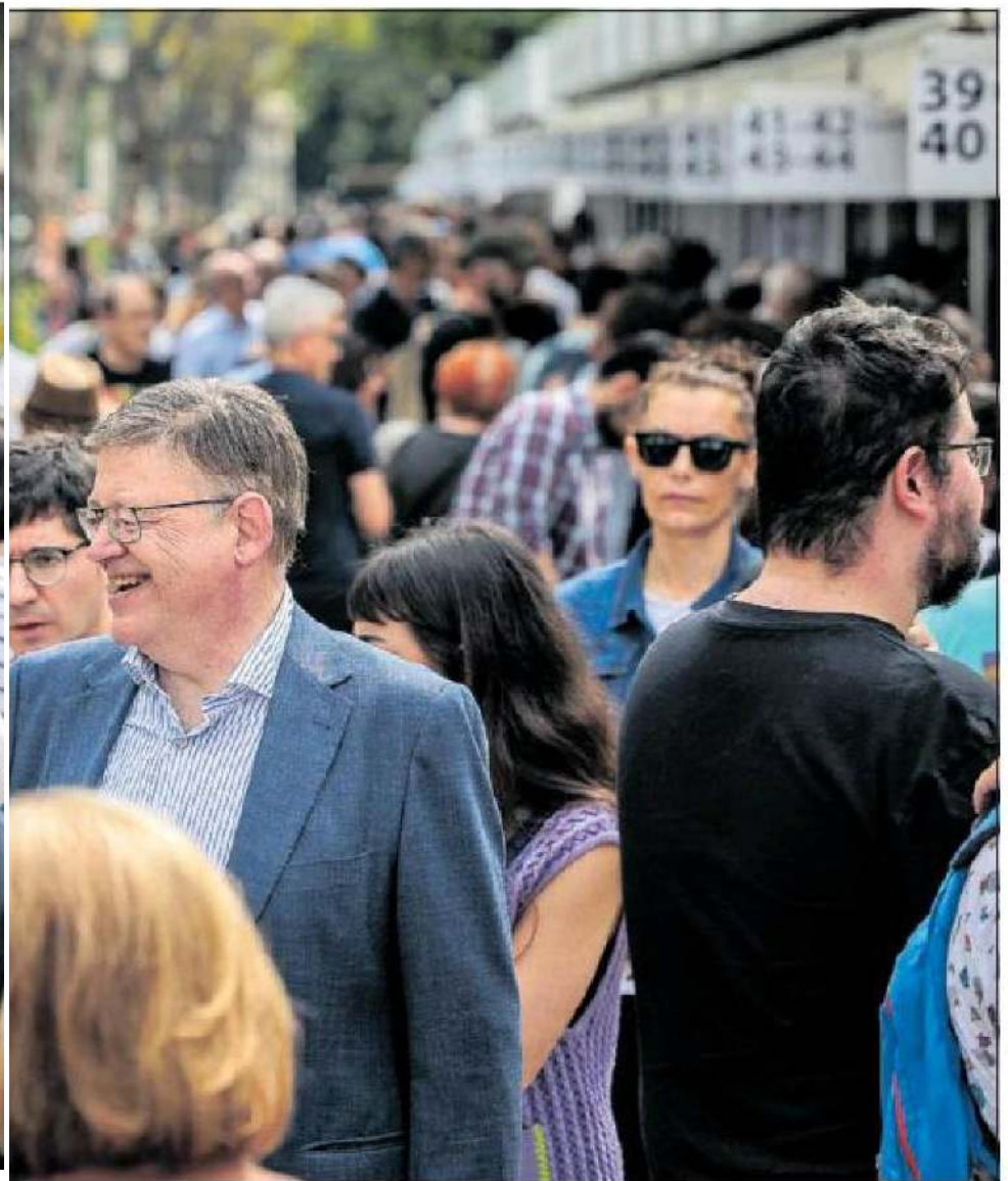
Ximo Puig visitaba el sábado la Fira del Llibre de València.