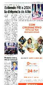
■ A puerta cerrada, el Consejo Político Nacional del PRI, se reunió en el auditorio Plutarco Elías Calles.