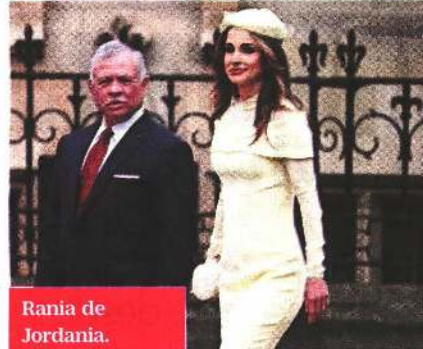
Rania de Jordania.