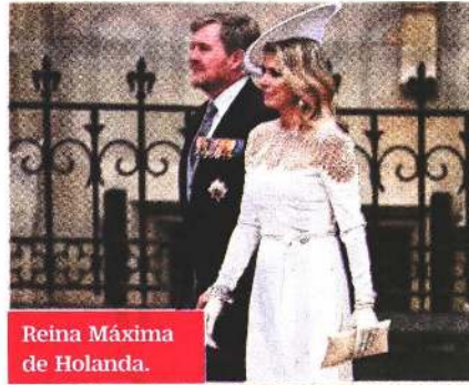
Reina Máxima de Holanda.