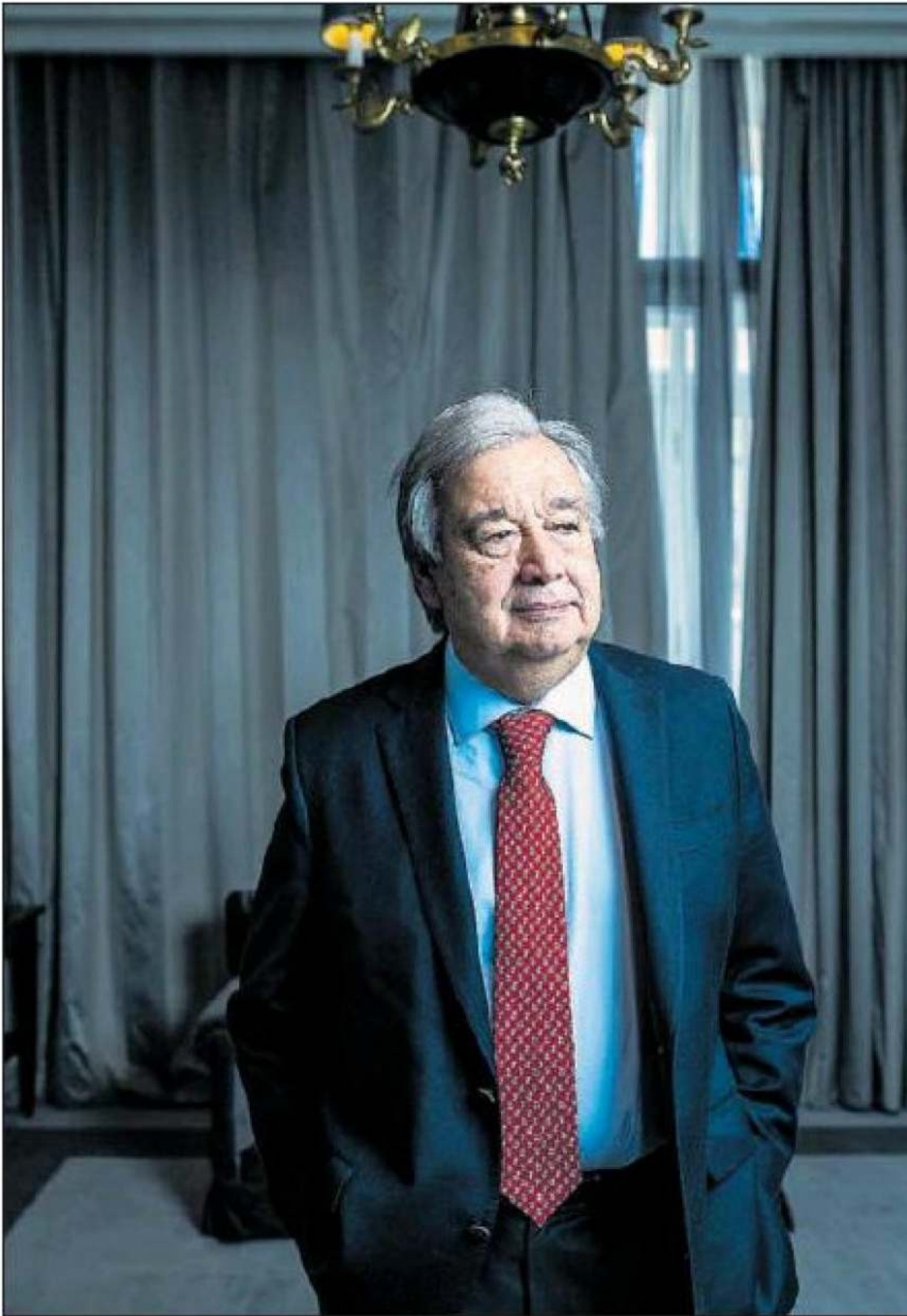
António Guterres, ayer en Madrid.