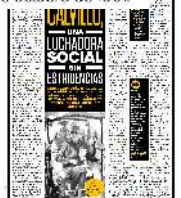
El doctor Salvador Nava, su esposa y partidarios, hacen la V de victoria al abandonar la cárcel preventiva el 5 de octubre de 1961.