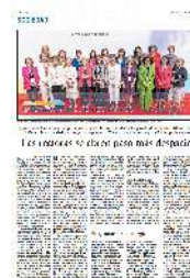
Las rectoras se abren paso más despacio

Aunque en un principio los socialistas en 2021 ligaron que los profesores titulares también pudiesen ser rectores a un ascenso