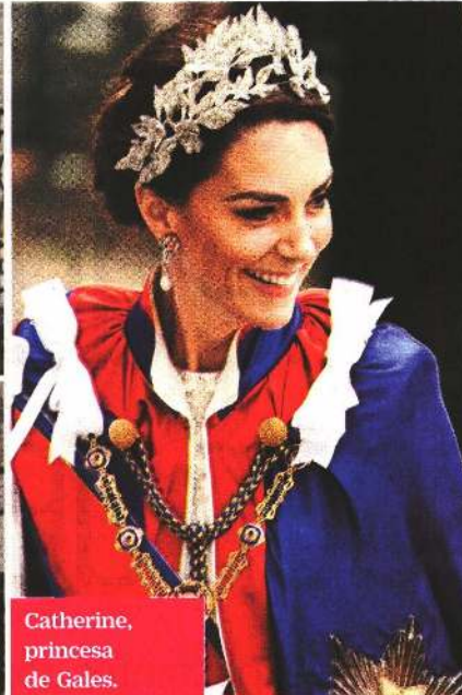
Catherine, princesa de Gales.