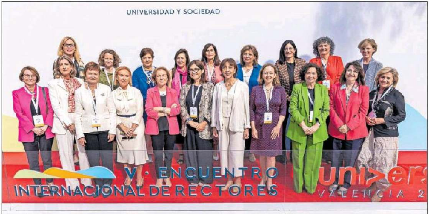
20 de las 23 rectoras que ejercen en universidades españolas, ayer en la Politécnica de Valencia, donde se celebra Universia 2023.