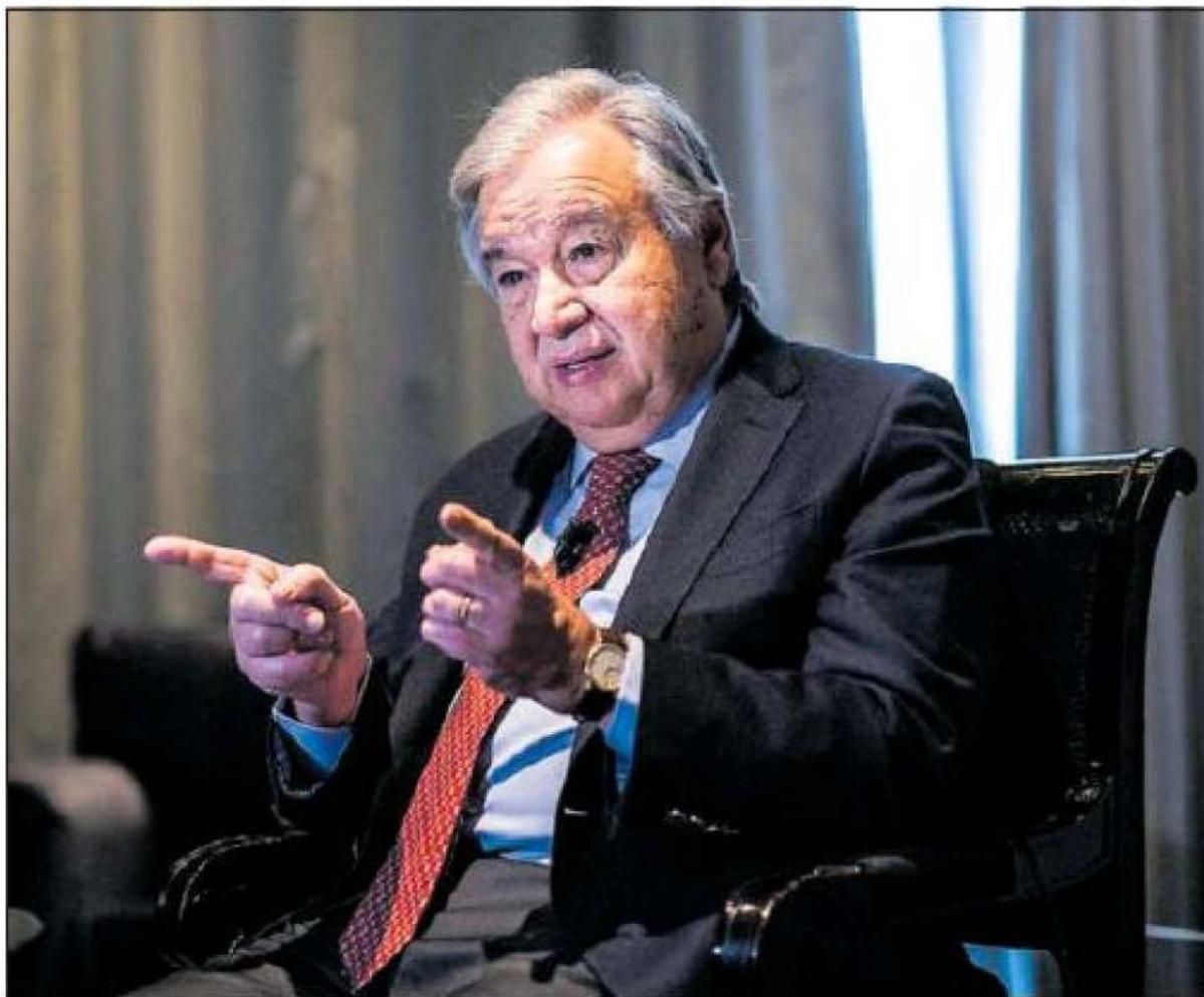
António Guterres, ayer durante su entrevista con EL PAÍS en Madrid.