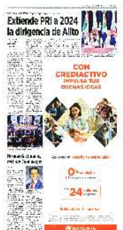
■ Alejandro Moreno, "Alito", en la votación para extender su dirigencia en el PRI hasta después de las elecciones de 2024.