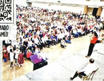
■ Mayo 14. Sheinbaum en un acto organizado en Sonora por Alfonso Durazo.